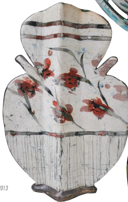
Abbildungen: Karl Fulle, Whosch, 2012